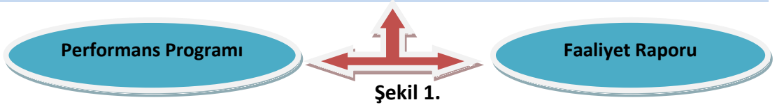
Stratejik Planlama Süreci Şeması